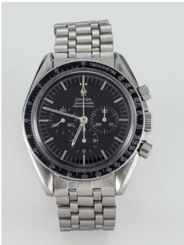
41 - visione frontale

Alla fine degli anni Cinquanta Pierre Moinat disegna lo Speedmaster ispirandosi ai contagiri e ai tachimetri delle auto sportive. Il cronografo è pensato per garantire ai professionisti una grafica più pulita e una migliore leggibilità, ne è un esempio lo spostamento della scala tachimetrica dal quadrante alla lunetta. Nel 1959 il design dello Speedmaster è caratterizzato non dall'incisione, come avveniva in precedenza, bensì dalla stampa (bianco su nero) della scala tachimetrica sulla lunetta. Nel 1963 verranno adottate le anse a elica con un rilievo sulla carrure a protezione dei pulsanti e della corona. Il modello che proponiamo rappresenta uno dei primi Speedmaster con anse piane, già collaudato dalla NASA. Un esemplare di rara reperibilità che ne fa un orologio di grande interesse collezionistico.