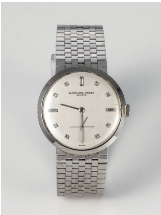
42 - visione frontale

Fondata a Le Brassus nel 1875 da Edward-Auguste Piguet e da Jules-Luis Audemars, la Audemars-Piguet è specializzata in orologi ultrapiatti e complicati e fin dall'Esposizione Universale del 1889 è un punto di riferimento del mercato.